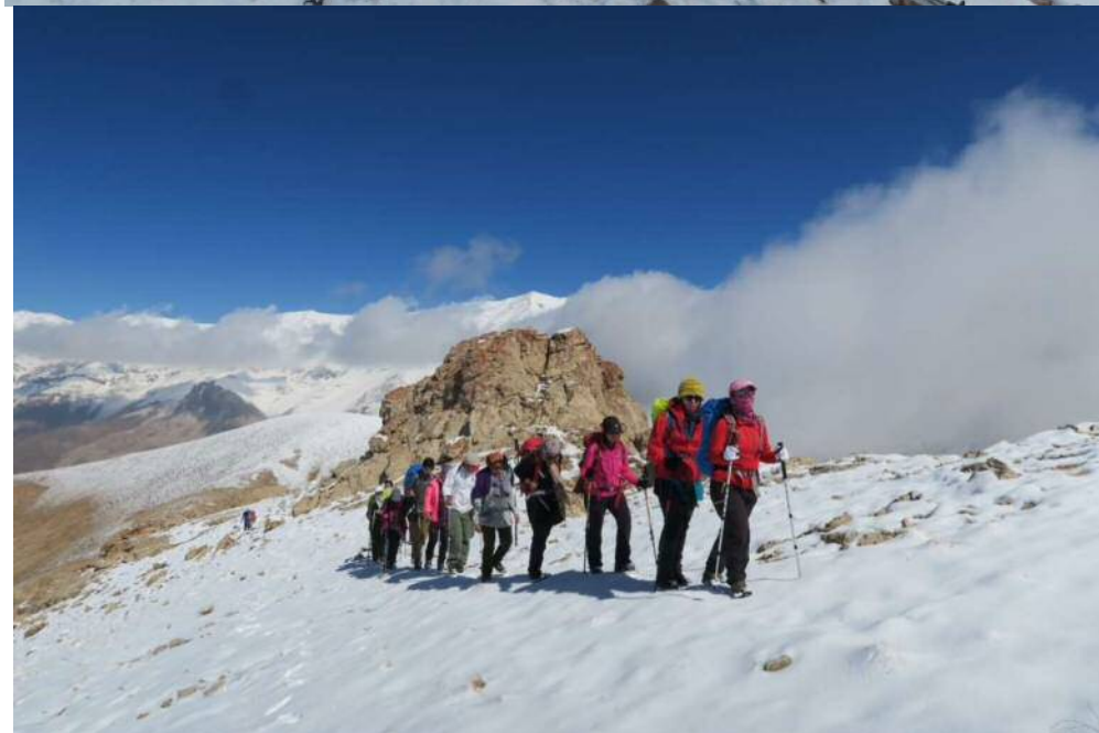
عکس های برنامه: